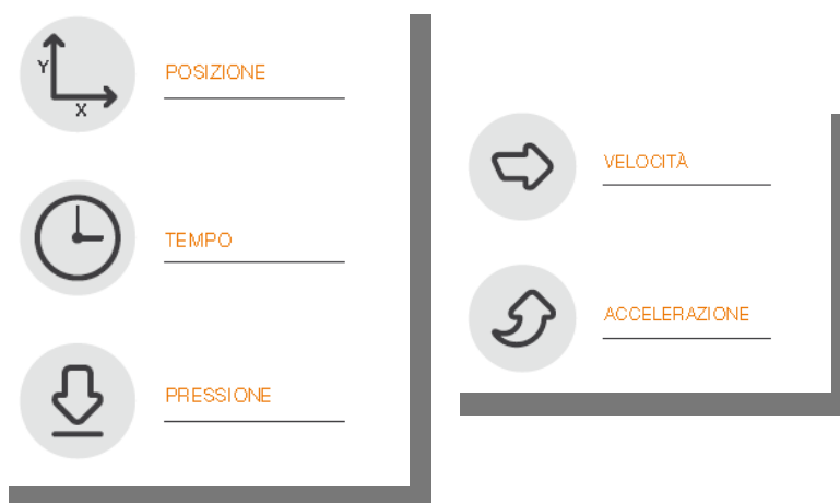
Fig.1 - Schema

E' possibile elaborare velocità e accelerazione ai fini di analisi forensi.