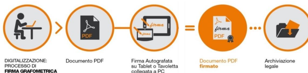
Fig.2 - Schema

I dati cifrati vengono successivamente inseriti nel pdf attraverso la creazione di una firma conforme allo standard europeo denominato PAdES. La soluzione prevede che, a sigillo di ogni firma apposta sul documento dal CLIENTE , sia applicato un certificato rilasciato da NAMIRIAL CA.